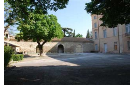
Le greffe et la salle de banquet <

Il est à proximité du greffe et de la salle du banquet.