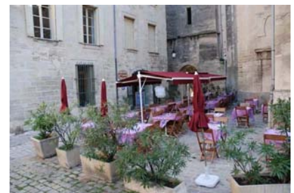
Le MYOU <