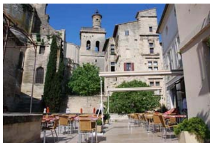
> Le ZANELLI