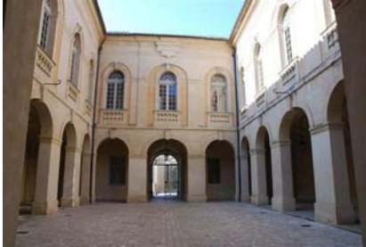
> Cour de la Mairie

Il est à proximité du greffe et de la salle du banquet.