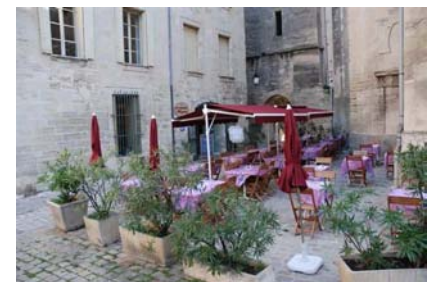
Le MYOU <