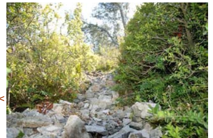
Sentier entre les cibles <

Comme vous pouvez le voir : les petits sentiers sont très jolis avec des buissons denses et épineux en bordure et il y a des cailloux, des cailloux et encore des cailloux... ce sont mes amis les long bow avec leurs splendides flèches en bois qui vont apprécier.