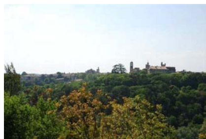
> Uzès vu du Hunter.

Le Field et le hunter seront installés au sommet du plateau face à la ville d'Uzès. Le point de vue est superbe ; pour ces deux parcours vous pourrez y accéder en voiture (il y a un grand parking).