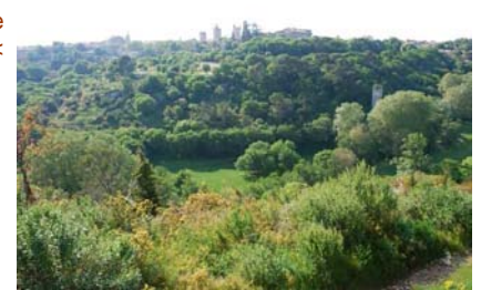
Vue d'Uzès et du practice depuis le Field <

Un conseil, faites tout de suite enregistrer votre matériel avant d'aller vous entraîner car, pour des raisons de sécurité, le practice a été implanté au pied de la ville d'Uzès à peu près à 500 mètres plus bas à pied. Alors n'oubliez rien !